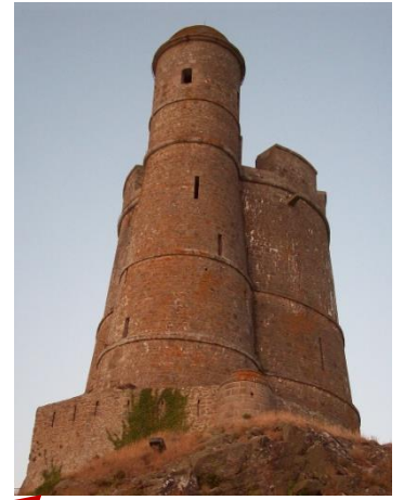
Il a été nettoyé depuis mais le lierre recommence à pousser. Photos juin 2013