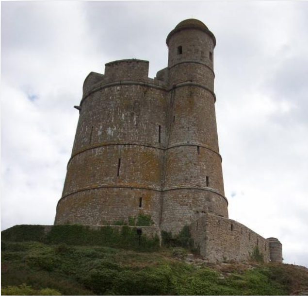
Le mur de protection de la tour couvert de lierre tel qu'il était en 2010