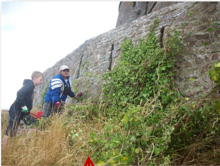
Suppression du lierre sur la face externe du mur, côté sémaphore