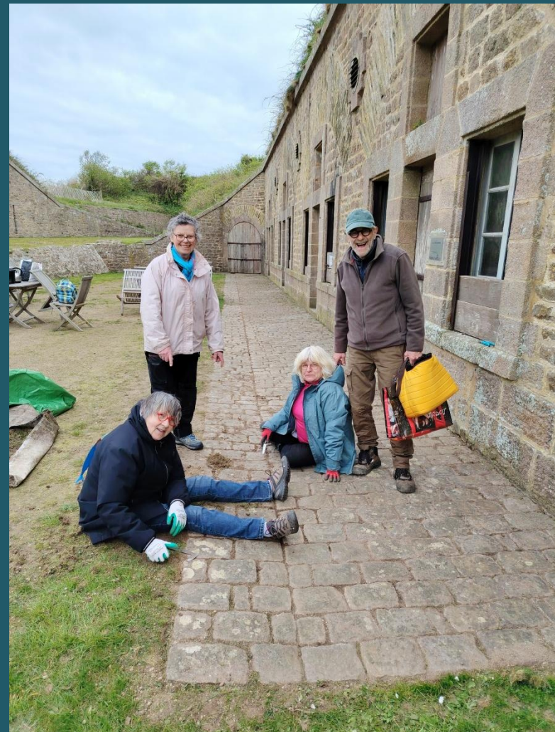
Le trottoir avant et après