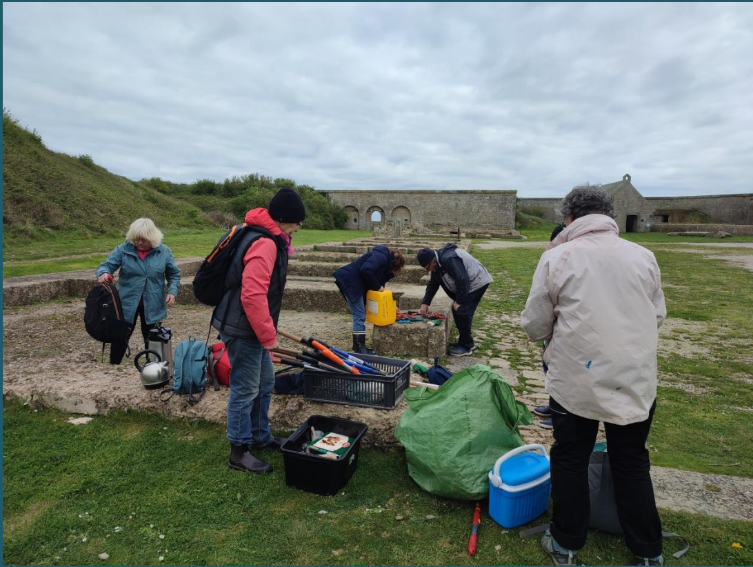
Vérification des outils avant de prendre le bateau