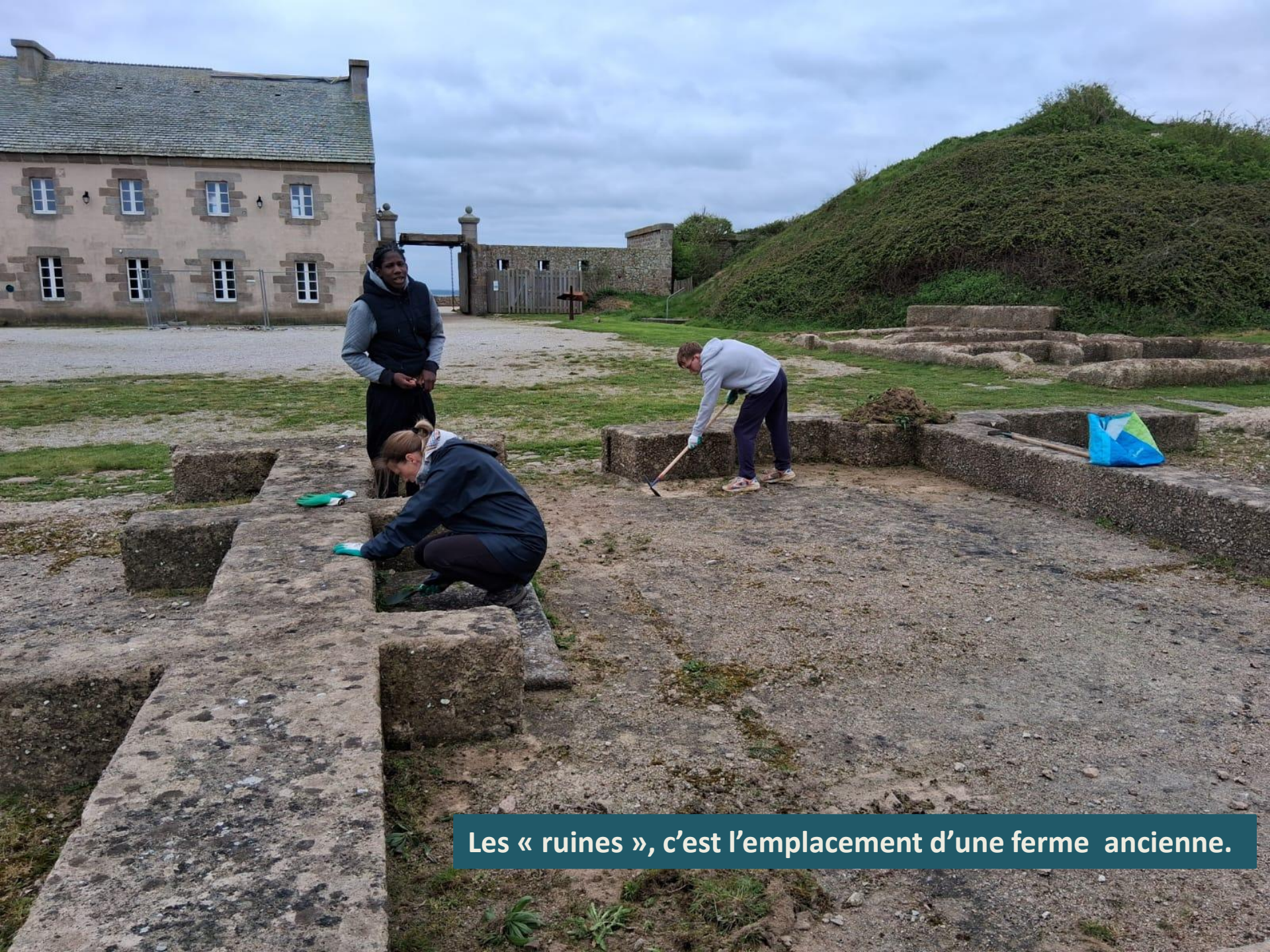
Les « ruines », c'est l'emplacement d'une ferme ancienne.